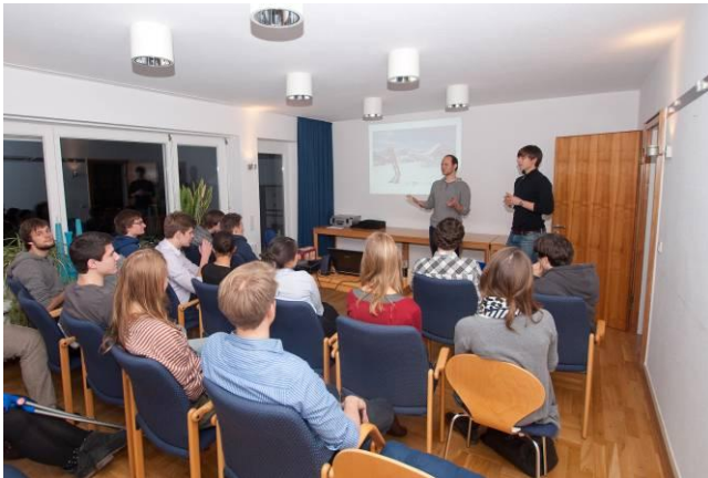
Offener Vortrag und Austausch zwischen Aktiven und Ehemaligen.