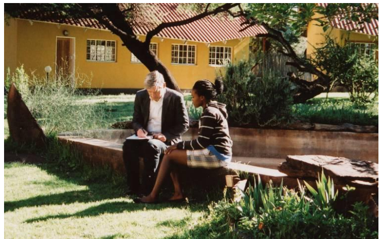
Zukunftsplanung 2011 – unter dem Kameldornbaum des Instituts