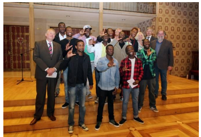
Die Preisträger: überrascht, erfreut und dankbar

Auch wir gratulieren dem Preisträger, der am Ende der offiziellen Veranstaltung das selbstkomponierte, in afrikanischem Dialekt vorgetragene Lied „My City“ aufführte.