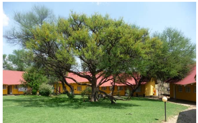
Der Schulkomplex: Erhalt der Infrastruktur für nachfolgende Jahrgänge

bildungsbetrieb in Baumgartsbrunn bereits eingestellt war. So hat uns im letzten halben Jahr manche Spende unter falschen Voraussetzungen erreicht. Und selbstverständlich werden wir diese unverzüglich zurück zahlen, wenn Sie dies wünschen. Wir sind allerdings für jede Spende dankbar, die nicht zurück gerufen wird, da wir die Erhaltung und Sicherung der Liegenschaften und Infrastruktureinrichtungen bis Ende 2012 gewährleisten wollen. So erhalten unsere namibischen Partner die Chance, das Lebenswerk des Ehepaars Bleks in einem guten Zustand zu übernehmen und fortzuführen. Hierfür sind etwa € 20.000.- für das Jahr 2012 erforderlich, die durch zweckgebundene Spenden noch nicht gedeckt sind.