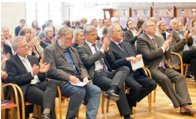
Anerkennende Zustimmung bei den Vertretern der Stadt und der Stiftung

„Diese Produktion lässt Menschen mit Migrationserfahrung nicht einfach zu Objekten entwicklungspolitischer Bildungsarbeit werden – hier sind sie selbst Akteure. 13 Jugendliche aus sechs afrikanischen Staaten bringen auf dem Hintergrund ihrer Transkulturalität eigene Texte und Gestaltungsideen ein und werden zu Subjekten in ihrem Schauspiel. Dramaturgie, Musik, Choreografie und Bühnengestaltung lagen ebenfalls in der Hand von Beteiligten mit afrikanischen Wurzeln.“