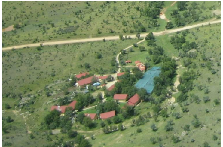
Die Berufsschule mit Internat, Werkstätten und Garten.

auch sehr wohl. In den Vollversammlungen aber trat dieses Verständnis in den Hintergrund, und allein die politisch engagierten Frauen führten das Wort. Schließlich bestreikten die Schülerinnen nicht nur wochenlang den Unterricht, sondern auch ihre Abschlussprüfungen, obwohl sie zuvor über die Konsequenzen unterrichtet worden waren. Daraufhin wurde die Schule geschlossen, und wir stimmten dem zu, hatten wir doch vor Ort erlebt, wie geduldig und kompromissbereit die Führung mit den jungen Frauen gesprochen hatte. Auch auf unsere Bitte hin wurde für die Schülerinnen noch die Möglichkeit geschaffen, ihre Prüfungen bei der staatlichen NTA (National Trading Association) nachzuholen. Und unsere Berufsschule unterstützte die Durchführung, indem sie die fehlenden Lehrer entsandte. So konnte schließlich doch noch sichergestellt werden, dass auch der letzte Jahrgang seine Ausbildung erfolgreich beendete, wenn auch auf viel holprigerem Wege, als eigentlich geplant.